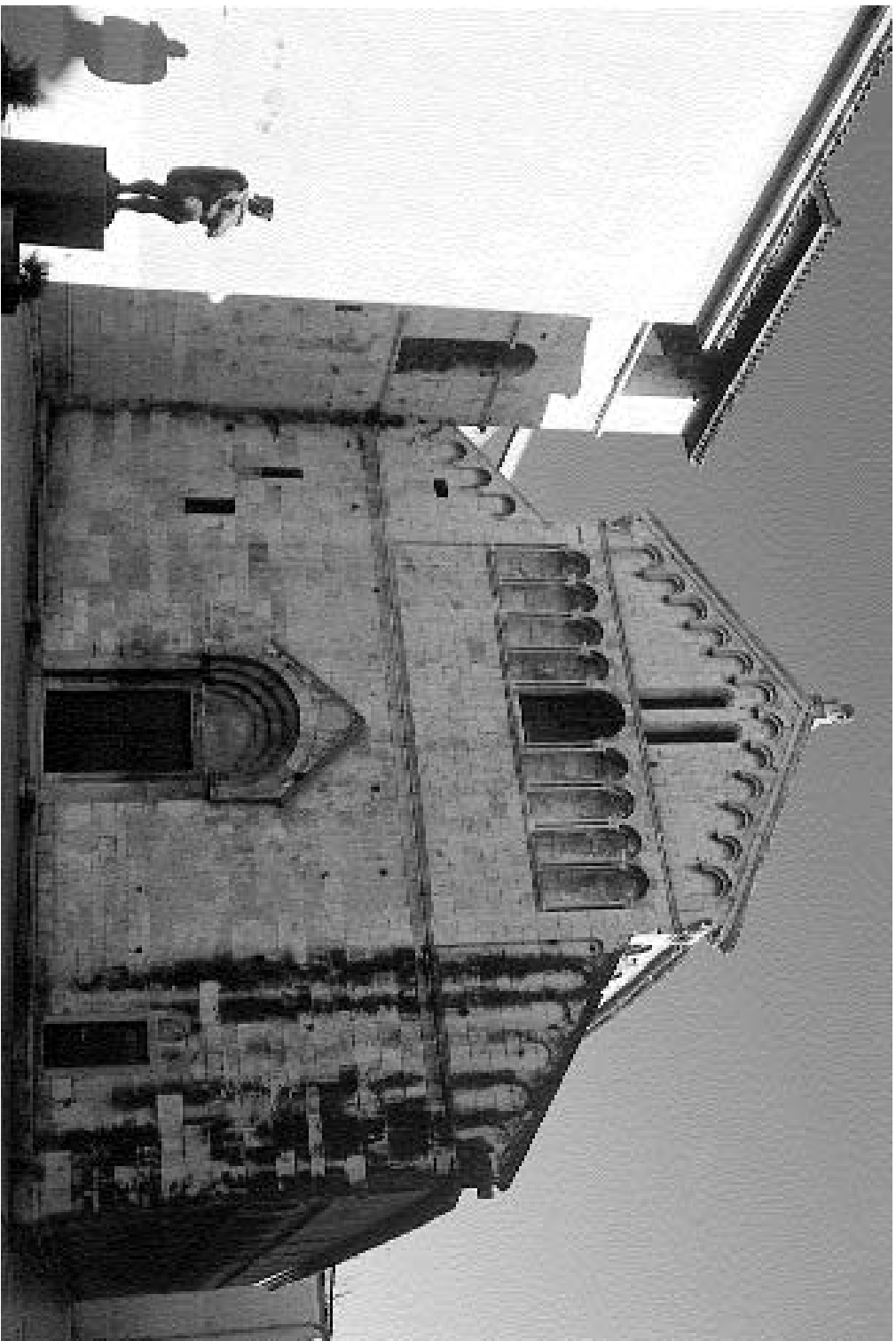
Crkva sv. Kriševana/St. Grisogonus's Church

Glazbene večeri u sv. Donatu/The Music Evenings in St. Donat's 40 godinalyears