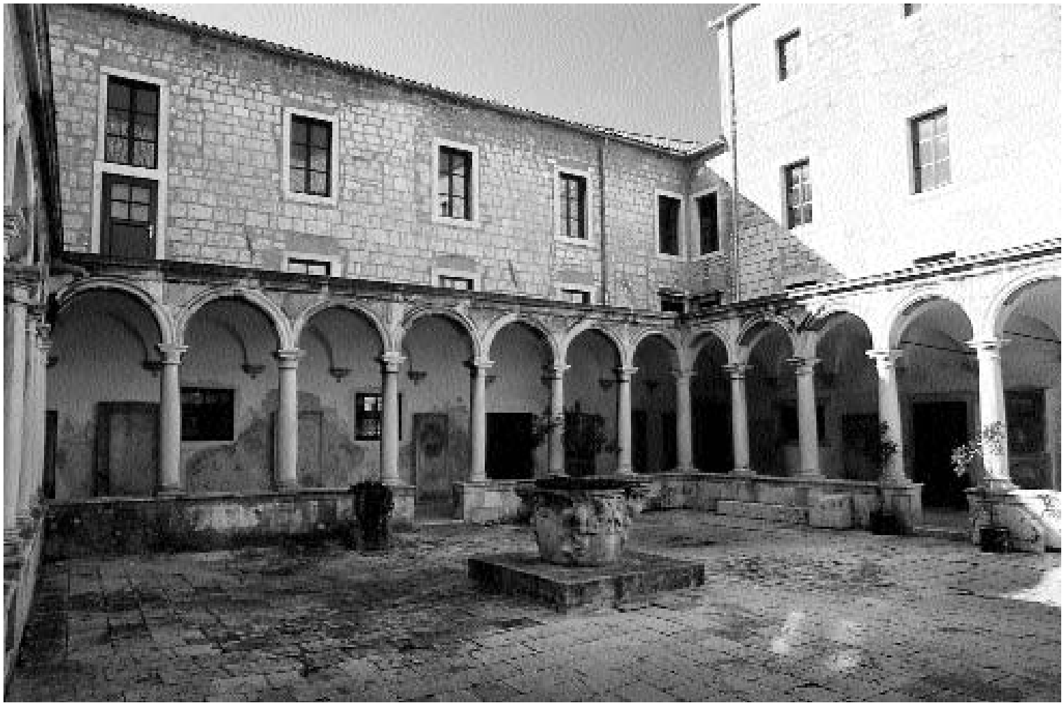
Klaustar sv. Frane|St Francis's Cloister